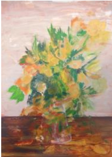
verblühte Blumen Acryl, 70x50, 2009