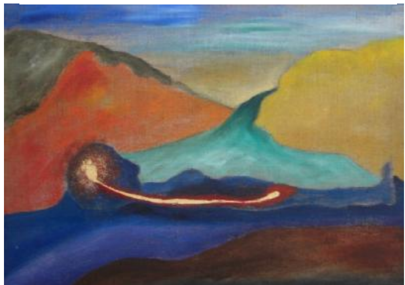
après avoir couché (WM) Öl auf Rupfen, 50x70, 2009